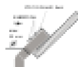
Схема крепления / подключения